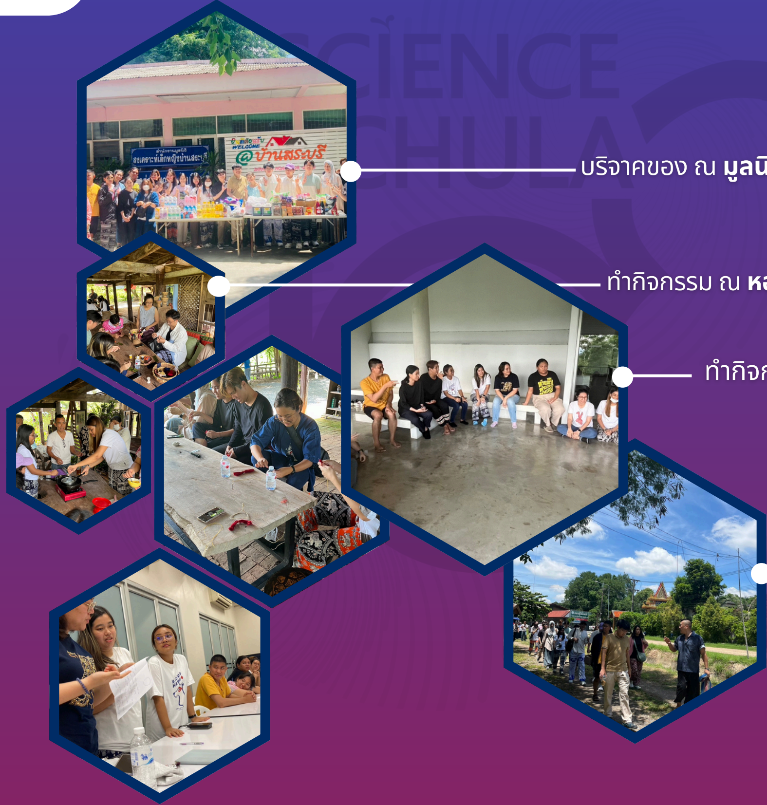
บริจาคของ ณ มูลนิธิสถานสงเคราะห์เด็กหญิงบ้านสระบุรี

วันที่ 6 - 7 กรกฎาคม 2567 ณ ศูนย์เครือข่ายการเรียนรู้เพื่อภูมิภาค จ.สระบุรี